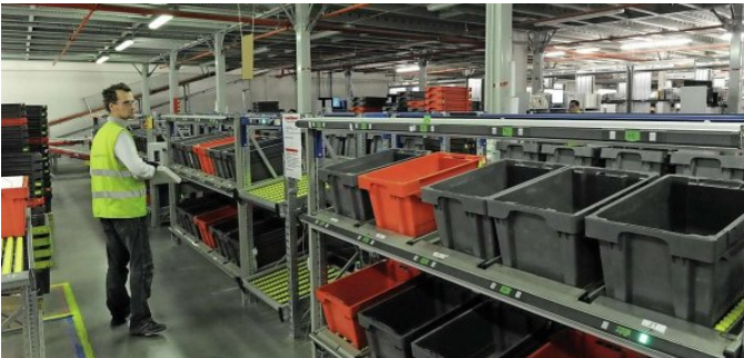
Třídící systém funguje na bázi put-to-light