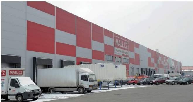
Distribuční centrum e-shopu Mall.cz ve VGP Parku Horní Počernice

větších rozměrů, tzv. velká bílá technika, a produkty střední velikosti. Mimo jiné se zde také nachází obří galerie na ploše 2000 m 2 . Ta má tři patra plus přízemí, celkově tak vzniklo dalších 6000 m 2 ložné plochy. Navíc se zde připravuje nový prostor (1200 m 2 ), který firma od dubna připojí ke stávajícímu skladu. "Každý rok se snažíme nějakým způsobem postupovat dopředu, rozvíjet skladové procesy, vylepšovat informační systémy. Už nyní jednáme s našimi dodavateli skladovacích systémů, abychom se připravili na příští vánoční sezónu, kdy očekáváme další nárůst objemů prodaného zboží," uzavírá Oldřich Petránek.