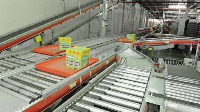
Dopravníkový systém prochází celou halou včetně galerie