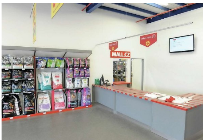
S distribučním centrem je propojena kamenná pobočka pro osobní odběr zboží