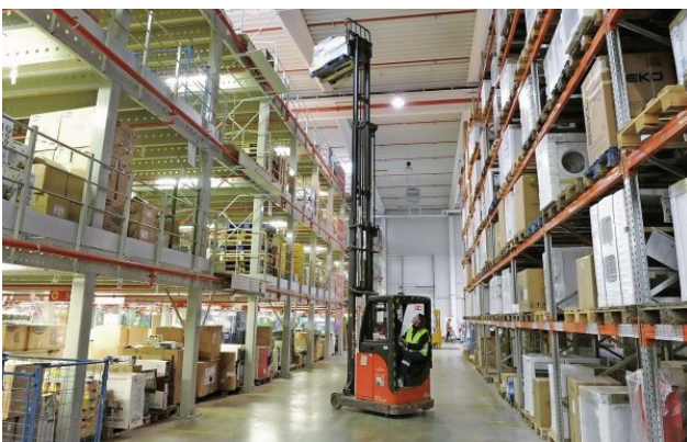
Nemalou část distribučního centra zabírají galerie