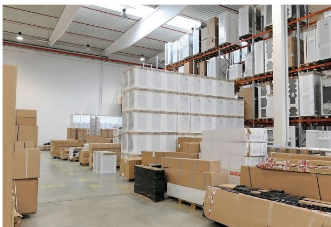
Mezi řadou skladovacích systémů, které se v hubu využívají, nechybí ani klasický blokový sklad na podlaze