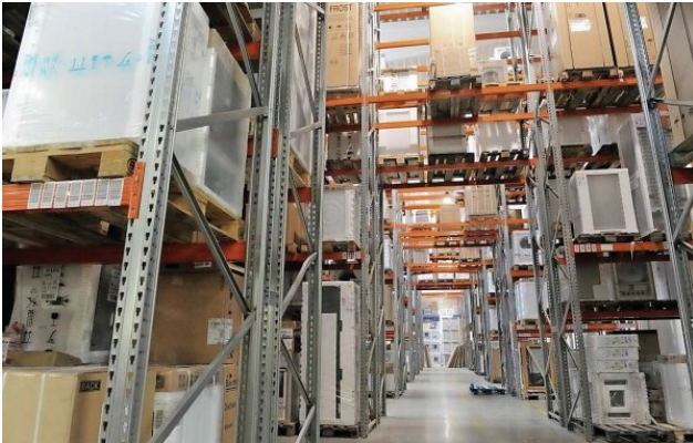
Výškový regálový sklad tzv. velké bílé techniky